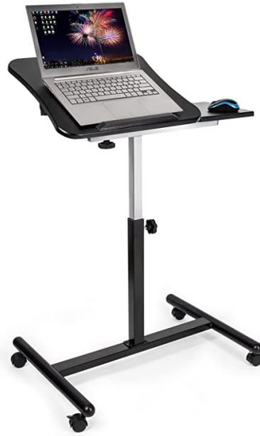
Soporte para portátiles