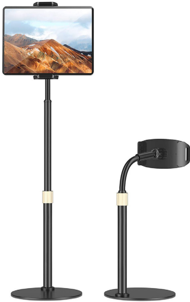
Soportes y brazos para telefonía o tabletas